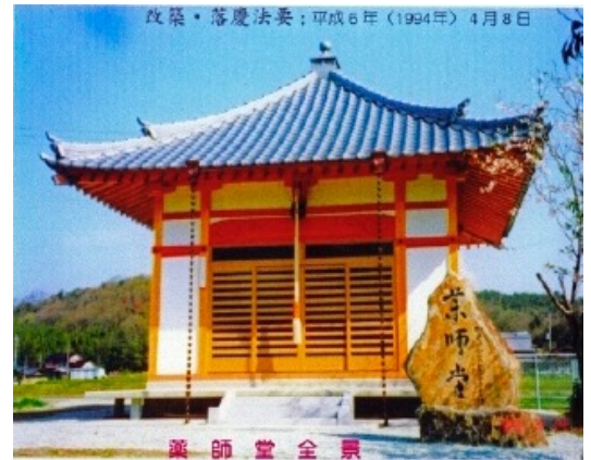
平成6年(1994年)再建当時の薬師堂

『薬師堂』— 金蔵院の飛び地に建立され代々吉井部落で管理されている。1980年頃に老朽化と台風により崩壊。その後1994年(平成6)年に再建し、4月5日に落慶法要が催された。同時に内陣仏堂(薬師如来坐像・弥勒菩薩坐像・弘法大師坐像)も修復された。また同時に建立された再建碑には、金蔵院・小山舜永大僧正による再建記が刻まれている。