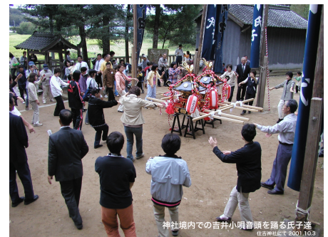
宮入後 境内で吉井小唄音頭を踊る氏子