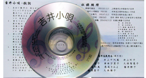
作成した吉井小唄 DVD

『吉井小唄音頭の編纂』— 1988年勇士方々の募金や自費による協力で新しい歌詞が編纂され「新吉井小唄」として誕生した。また踊りの振り付けもなされた。DVD収録にあたり、吉井婦人会の合唱団の方々、和太鼓や三味線などと競演しながら東条コスミックホールや公民館で練習を繰り返し、コスミック別館で本収録を成功させた。(DVDは関係各位へ配布し広く周知されるに至る)。