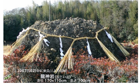
約 170×110cm、高さ 100cm の巨大岩 重さは数トンか

『龍神岩』— 東条川の黒岩付近 (現在のオアシス川北付近)に鎮座していた巨大岩を祀って、約二百年前から雨乞い神事の行事がなされていたようである。1987 (昭和 26) 年川沿いから住吉神社入り口に運び入れ祀られた。